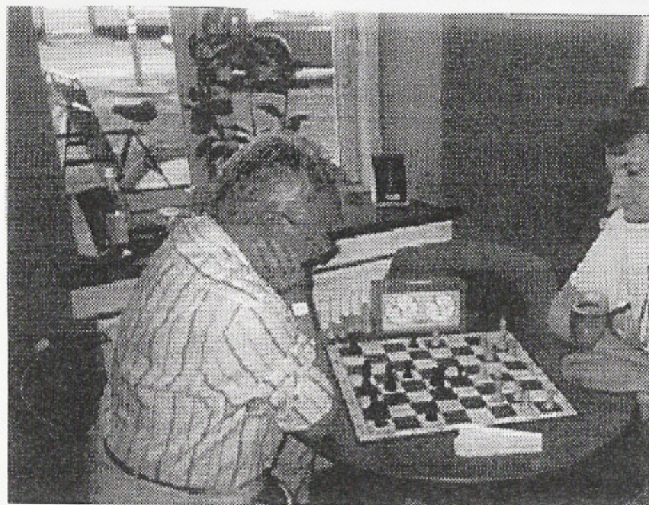
Der følger senere en mere udførlig resultatliste fra bymesterskabet